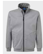
frost grey melange